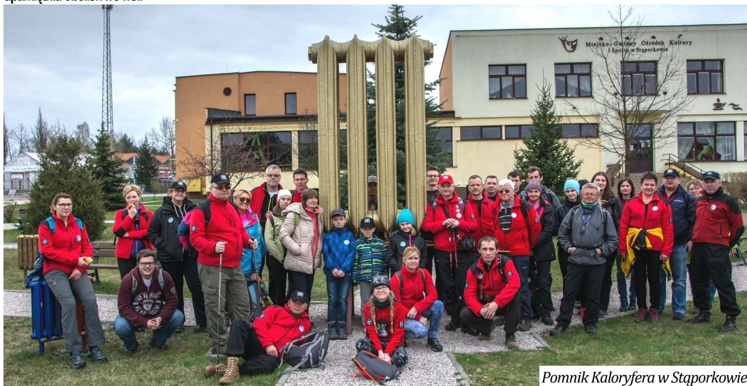
Pomnik Kaloryfera w Stąporkowie